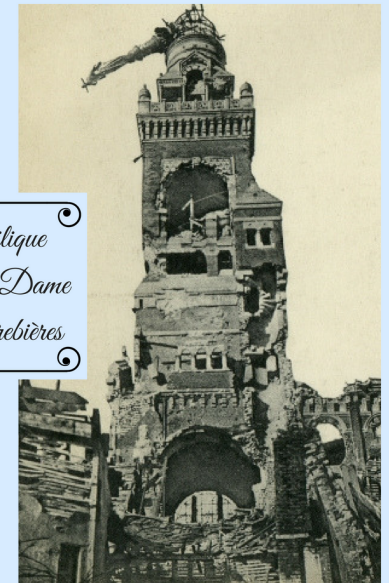
Basilique Notre-Dame de Brebières

LA BASILIQUE NOTRE DAME DE BREBIÈRES, EST DE STYLE NÉO-BYZANTIN. SON CLOCHER DORÉ EST RECOUVERT DE 40000 FEUILLES D'OR. ELLE FUT DÉTRUITE PENDANT LA PREMIÈRE GUERRE MONDIALE ET RECONSTRUITE À L'IDENTIQUE EN 1926