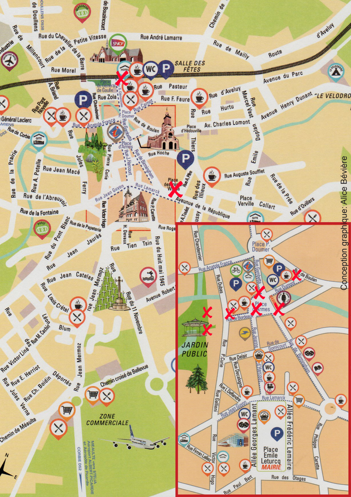
Conception graphique: Alice Bévière